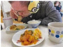
オーガニックランチ開始